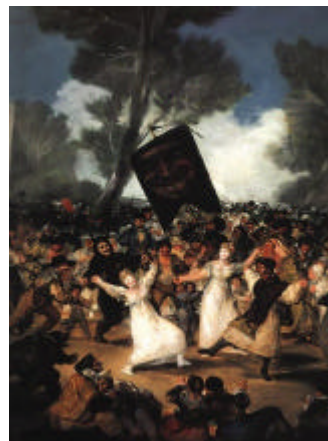
L'enterrament de la sardina. Fco. de Goya. 1814