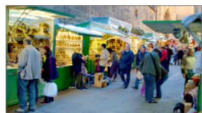
La Fira de Santa Llúcia de Barcelona

La veneració catalana per Santa Llúcia, verge i màrtir, es remunta al segle XIII. La dita popular ens indica que "De Santa Llúcia a Nadal dotze dies de cabal" i es que la seva festa se celebra el 13 de desembre. La santa és patrona de la vista i, en conseqüència, els qui més la necessiten per treballar (modistes, estudiants, etcètera) li tenen especial devoció.