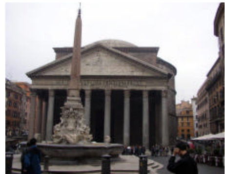
Panteó d'Agripa. s I aC

Tots Sants se celebra el dia 1 de novembre. Aquesta festivitat és una de les més antigues en el món cristià. El seu origen es troba al segle VII, quan el Papa Bonifaci IV, en comptes de fer enderrocar el Panteó de Roma (o sigui el temple pagà de Tots els Déus, que Marc Agripa havia fet construir en honor de Júpiter, en memòria de la victòria de l'emperador August sobre Marc Antoni i Cleopatra, el purificà i consagrà en honor de la Verge i de Tots els Màrtirs , i disposà que cada any fos celebrada una festa en la diada de la seva dedicació.