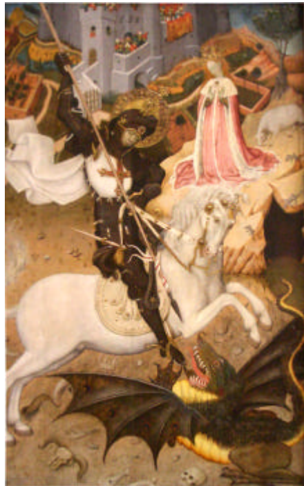
Sant Jordi. Bernat Martorell. S. XV

Quan portava una estona caminant se li va presentar un jove cavaller, cavalcat en un cavall blanc, i amb una armadura tota daurada i lluent. La donzella, esborronada , li digué que fugís de pressa, puix que per allí rondava una fera que així que el veiés en faria xixina . El cavaller li digué que no temés, que no li havia de passar res, ni a ell ni a ella, per tal com ell havia vingut expressament per combatre el monstre, per matar-lo i alliberar del sacrifici la princesa, com també la ciutat de Montblanc del flagell que li representava el veïnatge d'aquell monstre.