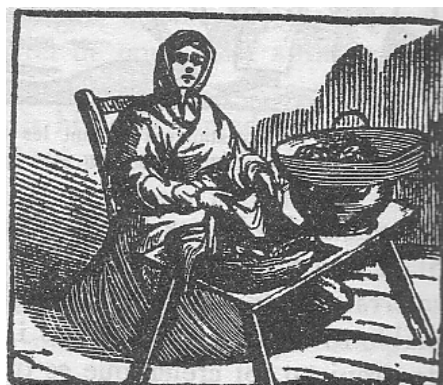
Castanyera. Il·lustració de principi del s. XX

Les castanyeres d'aquell temps vestien de manera pròpia. Duien unes faldilles de sargil molt amples i folrades, amb davantal de cànem i llana. Al cap duien una caputxa blanca de llana, molt llarga, que els arribava fins més avall de mitja faldilla. La duien lligada al coll i a la cintura.